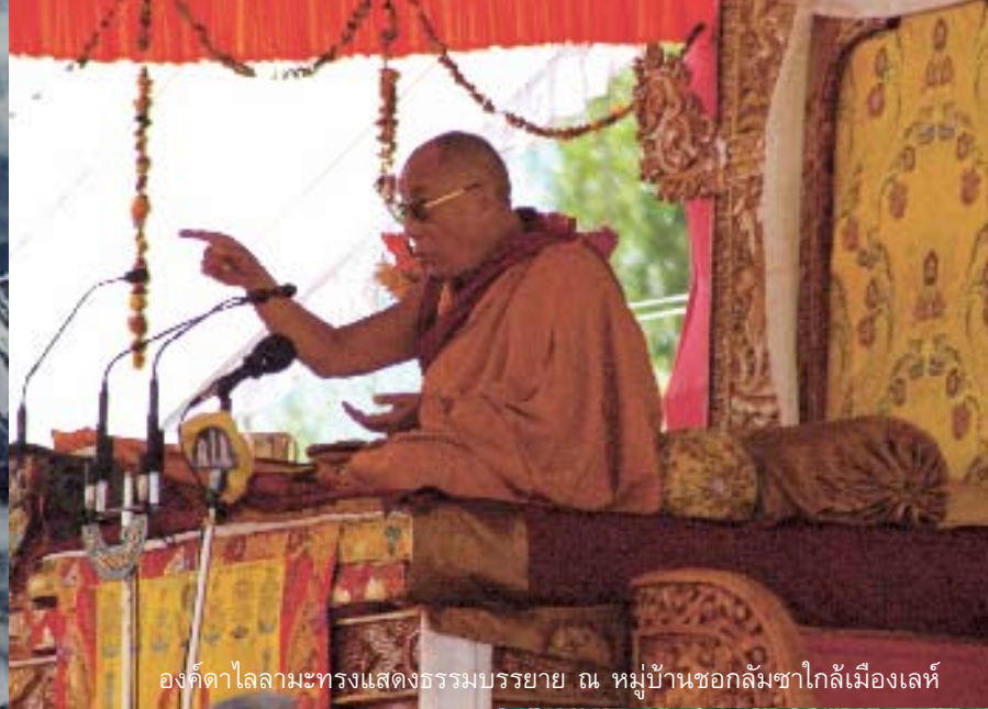
องค์ดาไลลามะทรงแสดงธรรมบรรยาย ณ หมู่บ้านชอกลัมซาไกล์เมืองเลห์