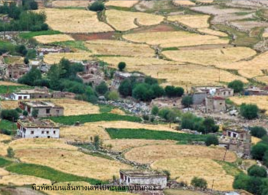
ทิวทัศน์บนเส้นทางเลห์ไปทะเลสาบบันกอง