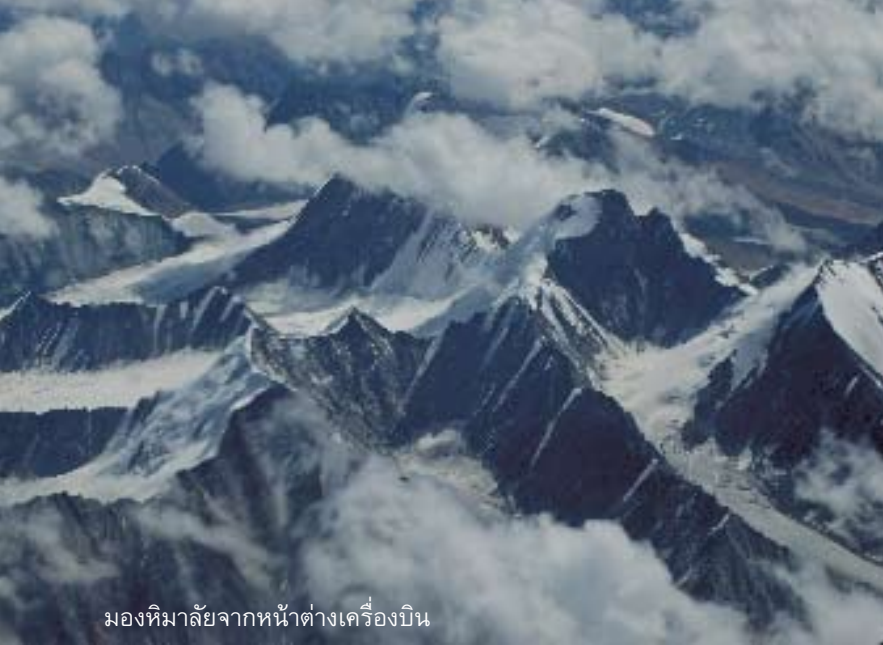
มองหิมาลัยจากหน้าต่างเครื่องบิน